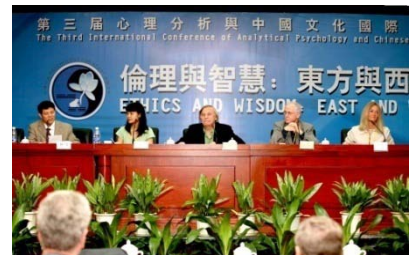
第三届心理分析与中国文化国际论坛现场、主题报告和 IAAP、ISST 暨华人心理分析联合会主要负责人