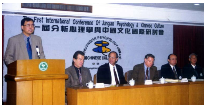
第一届心理分析与中国文化国际论坛开幕式

象征与心理的意义有所觉察并获得一种足够的认识……这次会议的期望是通过发现差异与同一，在东西方文化之间建立一种相互理解的桥梁。”