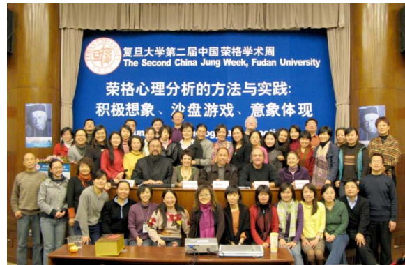
复旦大学第二届中国荣格学术周合影