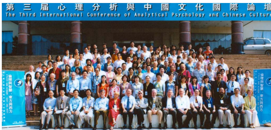
第三届心理分析与中国文化国际论坛合影