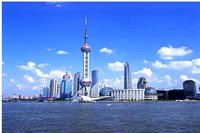
(overview of Shanghai, Pudong)

Shanghai is a fast growing city, with both ancient cultural heritage and modern achievements. The next World Exposition will be at Shanghai at 2010, with the theme of Better City, Better Life .