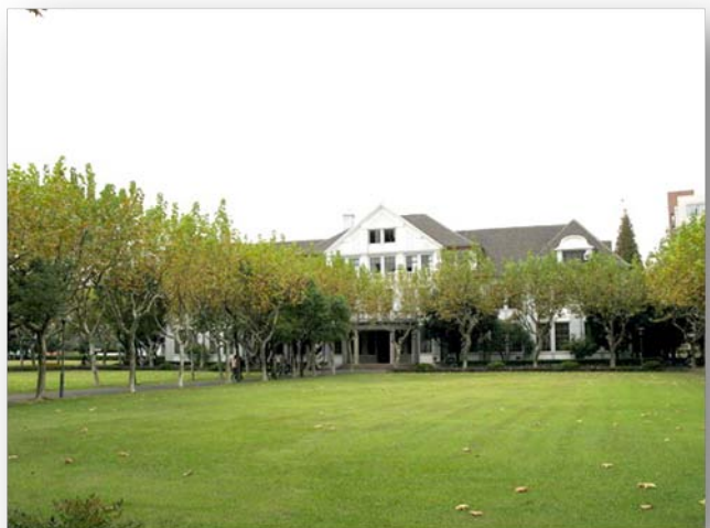
子彬楼，建于 1920 年代初期的复旦心理学院大楼

复旦大学具有深远的心理学传统，著名中国心理学家郭任远、章益、高觉敷等都是复旦大学的心理学教授。复旦大学早在 1923 年便建立了中国第一个心理学院，被誉为世界三大心理学院之一。复旦的子彬楼便是当年复旦心理学饮誉世界的见证。