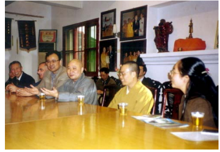
第一屆心理分析與中國文化國際論壇現場與主題報告和座談等

第二屆心理分析與中國文化國際論壇於 2002 年 9 月在廣州珠島賓館召開，五十餘位國際著名心理分析師和 100 餘位國內學者參加。國家衛生部副部長黃潔夫教授發來賀詞，其中提到：“心理分析是心理治療以及臨床心理學的重要基石，結合中國傳統文化研究心理分析有著深遠的意義，必能促進心理分析學術研究的深入。通過國際之間的相互學習和交流，我國的心理分析及文化心理學必能不斷發展，並能發揮其積極的心理教育和促進人們心理健康的作用。”