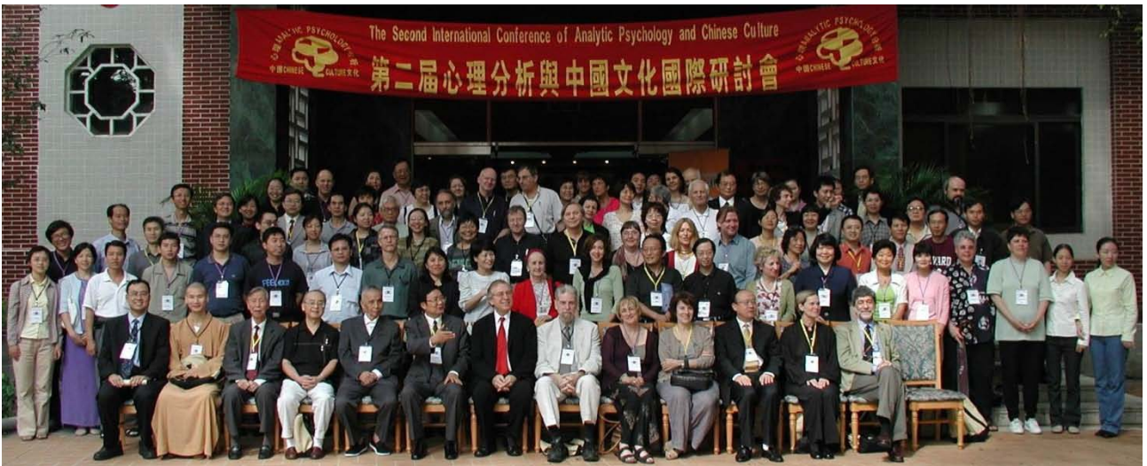
第二屆心理分析與中國文化國際論壇合影

第三屆心理分析與中國文化國際論壇於 2006 年 9 月在廣州龍洞天麓湖洗心島畔舉行，百余位國際著名心理分析師和二百余位國內學者參加。國際分析心理學會前後 5 任主席同時出席，國際沙盤遊戲治療學會主席、秘書長及諸多沙盤遊戲治療師同時與會。